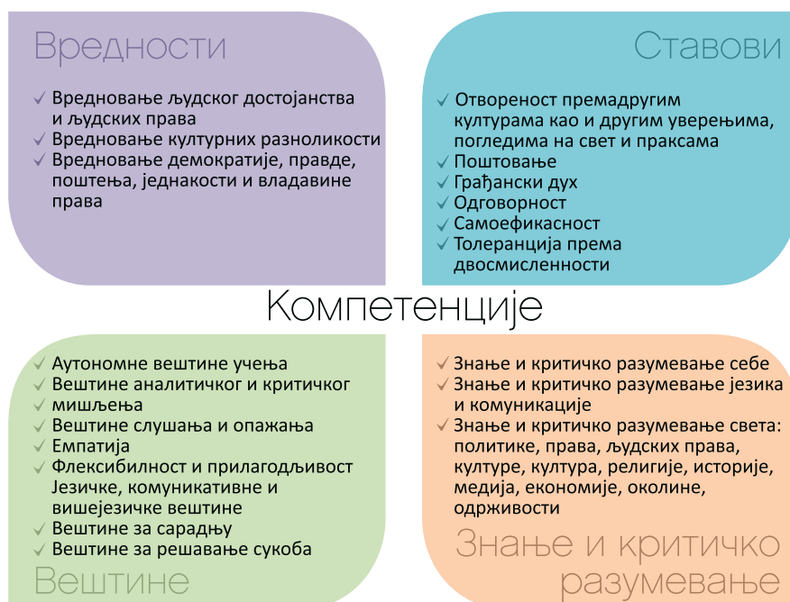
Илустрација 1 – Слика представља Референтни оквир компетенција за демократску културу са 20 компетенција.

Изазови у стварном животу са којима се у савременом друштву срећемо су: нетолеранција, дискриминација, недостатак емпатије, нетрпељивост и предрасуде према мањинским етничким и верским групама, вршњачко насиље, насиље у породици, низак степен одазива бирача на изборе, повећано неповерење у политичаре, велики степен кривичних дела из мржње, говор мржње, подршка насилном екстремизму итд. Према преузетој обавези, Савет Европе је наставио са промовисањем модела РОКДК који чини 20 компетенција (Илустрација 1) којима се вредности демократије примењују у школама и у свакодневном животу. У овом оквиру дефинисани су знање, вештине, вредности, ставови и критичко мишљење. 25